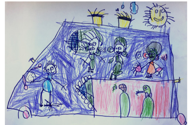
Bertík 3 roky „Policisté vezou zločince“.

Věnujme pozornost dětem, u kterých se spojuje nadání s handicapem různého druhu, stupně a intenzity. U této specifické skupiny nadaných dětí lze nadání obtížně identifikovat. Tyto děti bychom měli vnímat jako mimořádně zranitelné. Při souběhu nadání a handicapu se u dětí soustředíme zároveň na posilování jejich silných stránek i na vyrovnávání jejich deficitu.